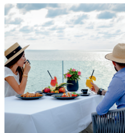
Открита тераса в ресторант Villa Chinka