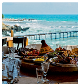
The Bay - където небето целува морето