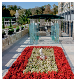
Просторната градина на Хотел Астор Гардън