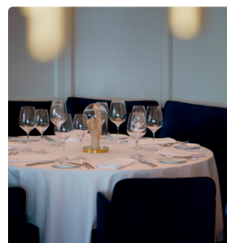
Ресторант Monty в Хотел Астор Гардън